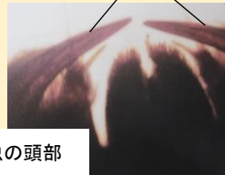
ゲンジボタルの幼虫の頭部

幼虫には大あごと呼ばれる口があり、その大あごでカワニナにかみつきます。大あごの中は、ストロー状になっていて、そのストローを通して、はじめにカワニナに蓋をされないようにしびれる毒を注入し、その後消化液を流し込んでカワニナを溶かします。その溶かした液をストローで吸います。