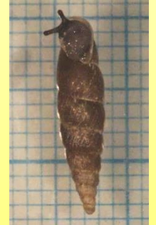
エサ (ナミコギセル)