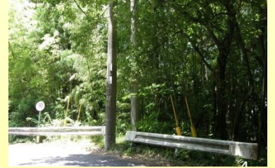
生息環境～竹林・杉林・雑木林など

ゲンジボタルやヘイケボタルと違って、 ヒメボタル の幼虫は、右の写真のような 林の中 で育ちます。エサも 陸の貝 を食べます。成虫は オスの方が大きい です。成虫のメスは後翅が退化して飛べません。オスは地面を這うメスを探すため、目玉がひと際大きくなっています。